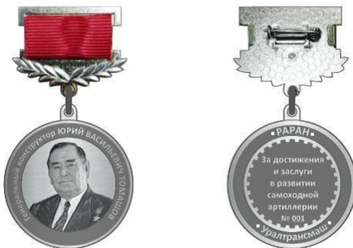
Рисунок 1 - Внешний вид Медали

5.1 Медаль изготавливается из серебра. Медаль имеет форму круга диаметром 32 мм и с двух сторон по окружности окаймлена выпуклым бортиком.